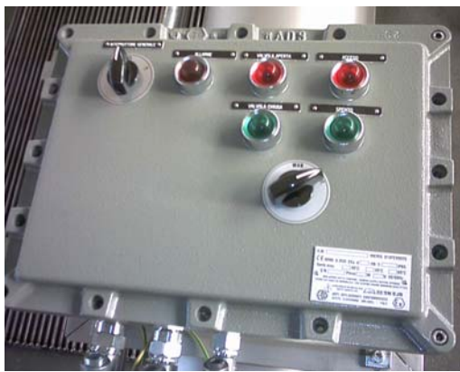
Pannello di controllo (Atex EExd) Control panel (Atex EExd)