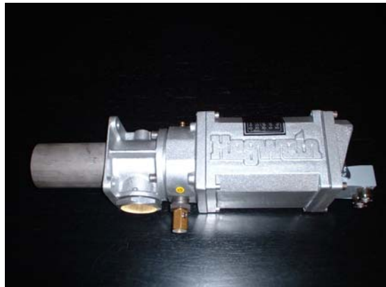
Accenditore pilota Pilot burner